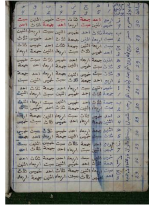
Gambar 3. Potongan Naskah kompilasi sistem hari Arbaiyah dan Khamsiyah, Surau Lubuk Ipuh.