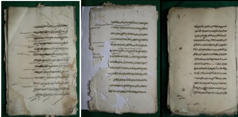
Gambar 1. Kompilasi Koleksi Naskah Fiqih Surau Bintangan Tinggi