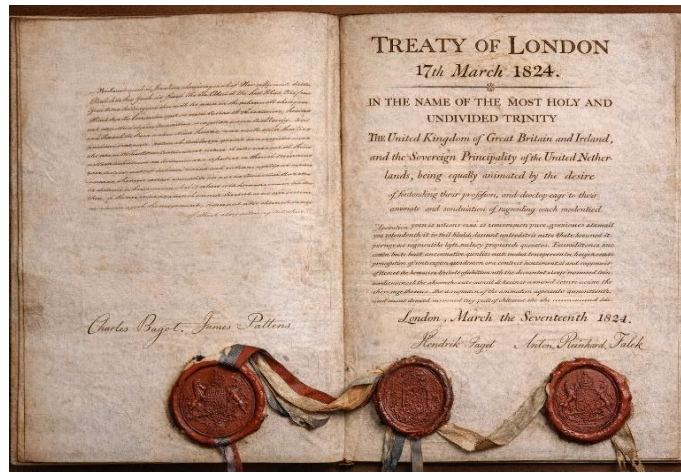
Gambar. 2. Traktat London

Hingga kini, Traktat London dipandang sebagai salah satu faktor penting yang membentuk sejarah kolonial dan pascakolonial Indonesia.