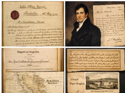
Gambar 3. Surat Pribadi Cornelis Raflesh

Salah satu peninggalan kolonial Inggris yang menjadi kekuatan memori kolektif bagi masyarakat Bengkulu nama benteng ini diambil dari John Churchill, Duke of Marlborough, seorang tokoh militer terkenal Inggris yang dianggap sebagai salah satu pemimpin besar Inggris pada masa itu. Pemberian nama ini menunjukkan hubungan antara pembangunan benteng dengan prestasi militer Inggris.