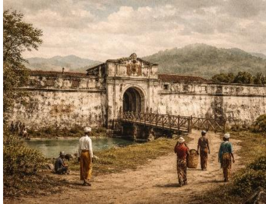
Gambar 4. Benteng Marlborough

Setelah Inggris meninggalkan Bengkulu pada tahun 1824, wilayah tersebut kembali berada di bawah kekuasaan Belanda. Benteng Marlborough pun beralih menjadi bagian dari kekuasaan kolonial Belanda, namun pengaruh Inggris tetap terlihat dalam struktur benteng ini. Benteng ini menjadi saksi sejarah peralihan kekuasaan dan sebagai bagian dari warisan kolonial Eropa yang ada di Indonesia.