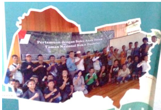
Gambar 2. Dokumentasi Dialog Bersama SAD dalam Pengelolaan Zonasi TNBD di Resort 2E Air Hitam.