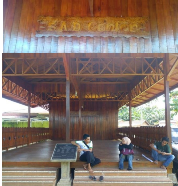
Gambar 5. SAD Center 11

Tujuan utama dari kegiatan penjangkauan konservasi adalah untuk meningkatkan kesadaran masyarakat, khususnya di sekitar kawasan tersebut akan pentingnya keberadaan kawasan konservasi. Kegiatan ini dilakukan secara rutin dengan tujuan untuk menyebarkan informasi kepada kelompok sasaran tertentu, antara lain masyarakat desa, komunitas SAD dan pelajar. Kegiatan yang dirancang untuk komunitas SAD memerlukan kolaborasi besar dengan lembaga lain, termasuk Puskesmas dan Dinas Kesehatan untuk urusan kesehatan dan Dinas Pendidikan untuk keperluan pendidikan. Selain program sosialisasi kepada kelompok dewasa di atas, program ini juga menyasar anak-anak dan remaja dengan tujuan untuk menumbuhkan kesadaran sejak dini akan pentingnya menjaga dan mencintai alam sekitar yang telah diberikan Tuhan. Kegiatan tersebut dilaksanakan dalam berbagai format, antara lain lomba melukis tingkat daerah untuk siswa SD, bertemakan konservasi sumber daya alam dan ekosistem. Selanjutnya kegiatan ini telah dilakukan secara rutin di dua sektor pengelolaan TNBD yaitu SPTN wilayah I Batanghari dan SPTN wilayah II Tebo.