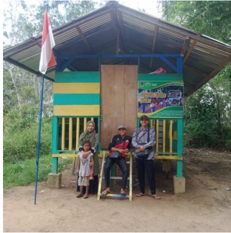
Gambar 6. Potret bersama peserta didik Suku Anak Dalam pada pondok belajar SAD yang dibangun pengelola TNBD