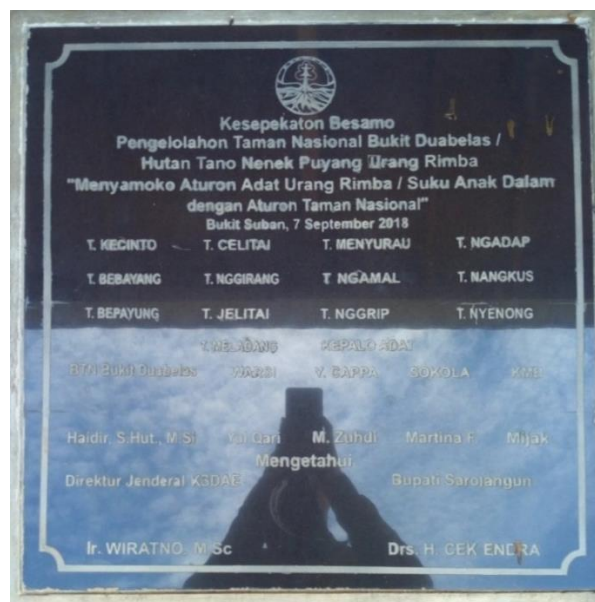
Gambar 4. Kesepakatan Bersama Pengelolaan Taman Nasional Bukit Duabelas, Hutan Tano Nenek Puyang Urang Rimba

Tim konservasi TNBD saat ini terdiri dari 33 anggota KKP, 42 anggota MMP, dan 60 kader konservasi. Keterlibatan masyarakat yang terlibat dalam MMP dan MMA khususnya pada ranah perlindungan dan pengamanan hutan. Sementara itu, kader konservasi melakukan kegiatan sosialisasi yang menysasar masyarakat desa dan komunitas SAD yang berada di hutan TNBD atau di sekitar kawasan TNBD. Selanjutnya, serangkaian kebakaran hutan dipicu oleh warga sekitar yang melakukan pembukaan perkebunan kelapa sawit dengan menggunakan pembakaran terkendali. Kondisi cuaca panas dan kering yang terjadi berkontribusi terhadap cepatnya penyebaran api hingga mencapai kawasan hutan TNBD. Untuk memperbaiki kerusakan yang terjadi, Balai TNBD bekerja sama dengan POLHUT, MPA, Manggala Agni Batanghari, masyarakat setempat, dan kelompok SAD melaksanakan proyek reboisasi di hutan yang terkena dampak kebakaran, dengan memanfaatkan tanaman yang ada. bermanfaat bagi kelompok SAD.